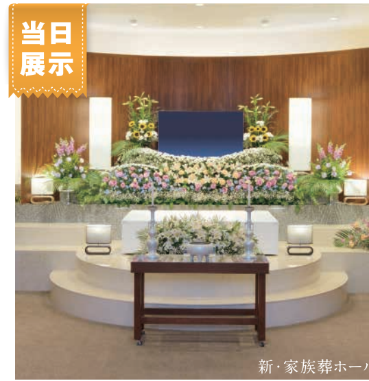
新・家族葬ホール