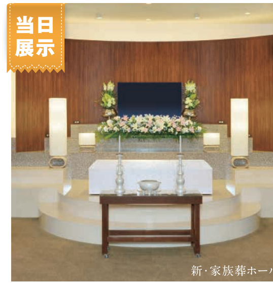
新・家族葬ホール