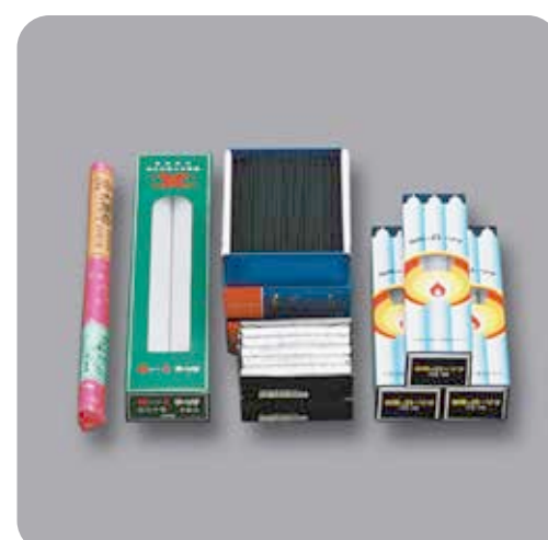
ローソク・線香セット